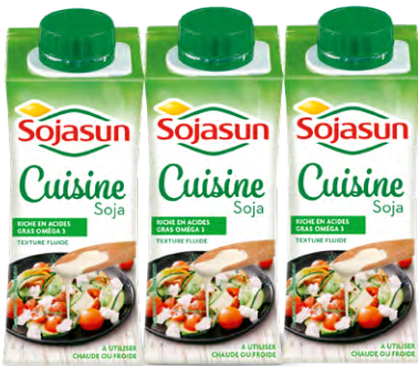
SOJASUN CUISINE UHT Le lot de 3 x 20 cl 60 cl Le L : 659 F 395 F LE LOT DE 3