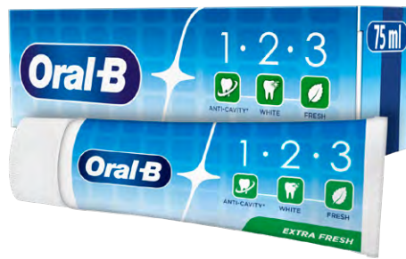
DENTIFRICE 1-2-3 ORAL B EXTRA FRESH Le tube de 75 ml Le L : 1934 F 145 F LE TUBE