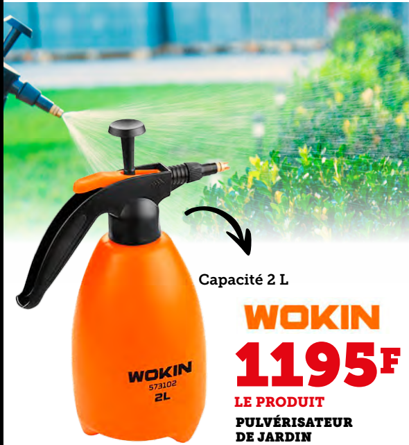
Capacité 2 L