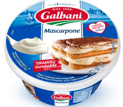
FROMAGE MASCARPONE 41,5% GALBANI Le pot de 250 g Le kg : 2100 g 525 F LE POT