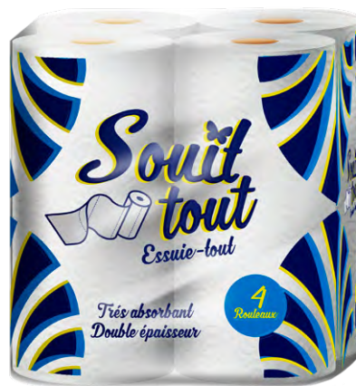
ESSUIE-TOUT SOUIT Les 4 rouleaux 375 F LE PAQUET