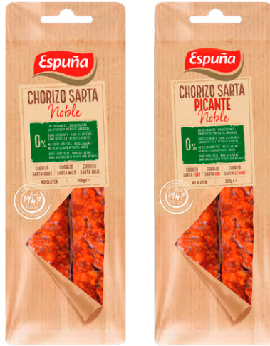
CHORIZO NOBLE OU PIQUANT ESPUÑA Le paquet de 200 g Le kg : 3175 F 635 F LE PAQUET