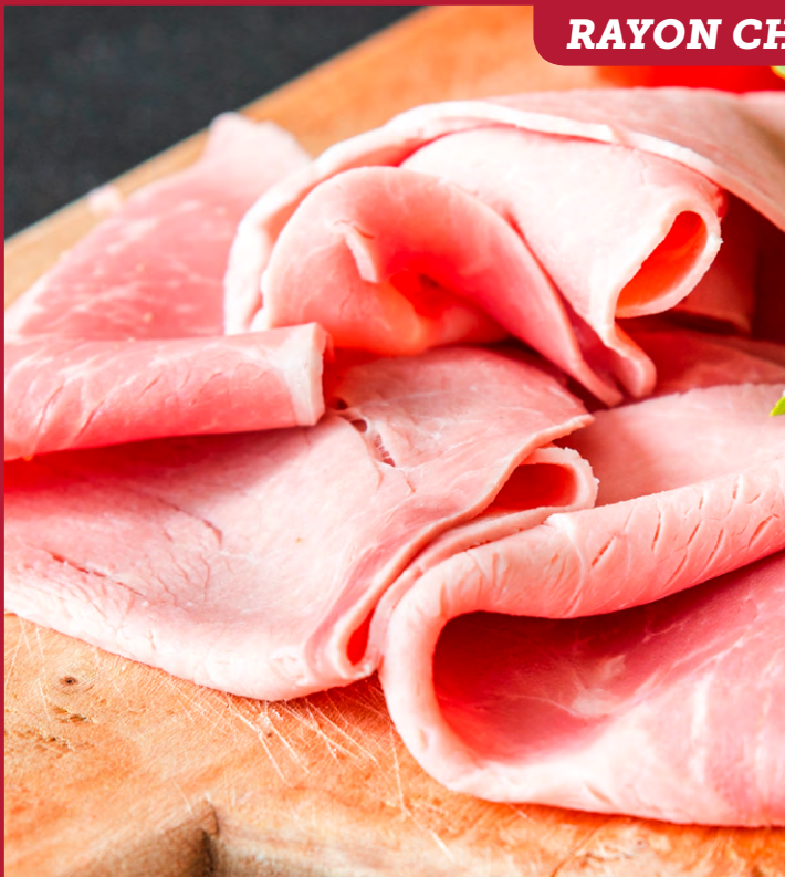
JAMBON SUPÉRIEUR NATURE Origine France