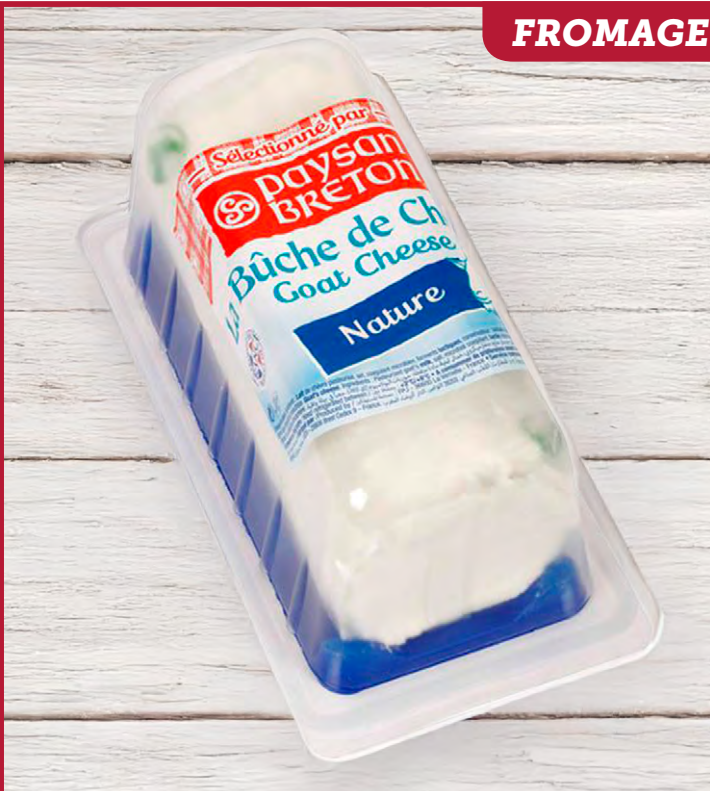
BÛCHE DE CHÈVRE NATURE OU AIL & FINES HERBES PLU : 16704 - 16714 Origine France