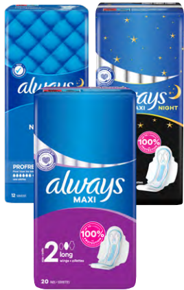
1+1 OFFERT 560 F LE LOT DE 2 SERVIETTE HYGIÉNIQUE ALWAYS MAXI Au choix : nuit / profresh nuit / long Le paquet de 12, 16 ou 20 serviettes