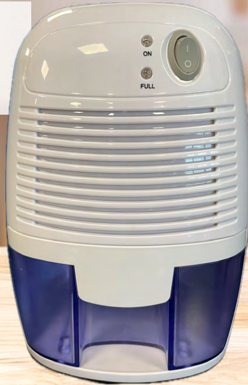
Capacité 0,5 L

LE PRODUIT DÉSHUMIDIFICATEUR AUTOMATIQUE Capacité : 0,5 L Dim. 130 x 220 x 156 cm Poids : 1040 g