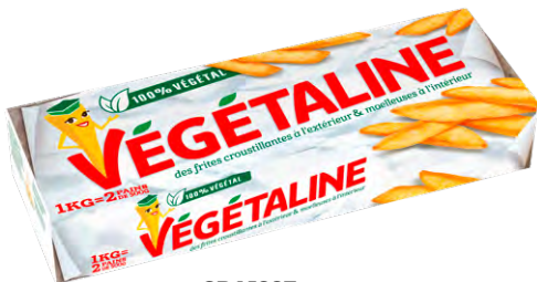
GRAISSE 100% V G TALE V G TALINE La bo te de 2 pains x 500 g : 1 kg 795 F LA BO TE