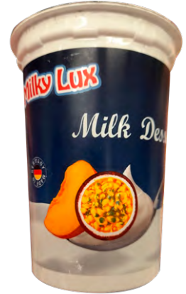
DESSERT LACTÉ MILKY LUX Au choix : pêche/passion, fraise Le pot de 500 g Le kg : 490 F 245 F LE POT