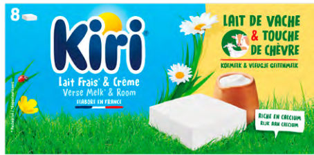
KIRI LAIT DE VACHE ET TOUCHE DE CH VRE La bo te de 8 - 144 g Le kg : 3091 F 445 F LA BO TE