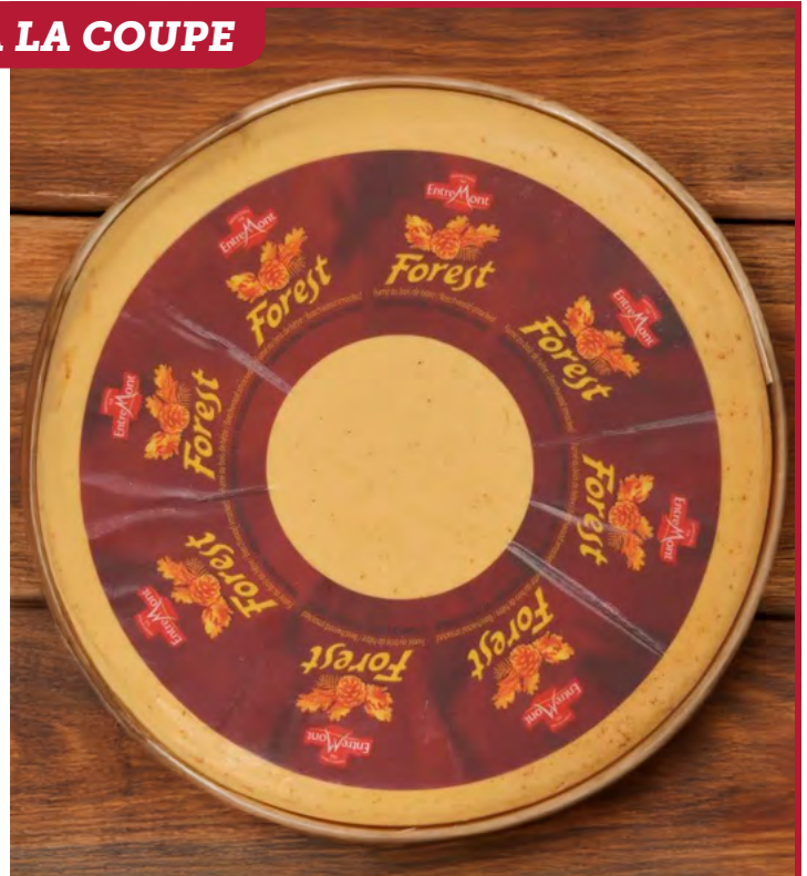
FONDU FUMÉ FOREST 27,5% ENTREMONT PLU : 8872 Origine France