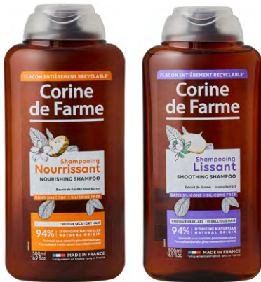
SHAMPOING CORINE DE FARME Le flacon de 500 ml Différents parfums Le L : 790 F 395 F LE FLACON