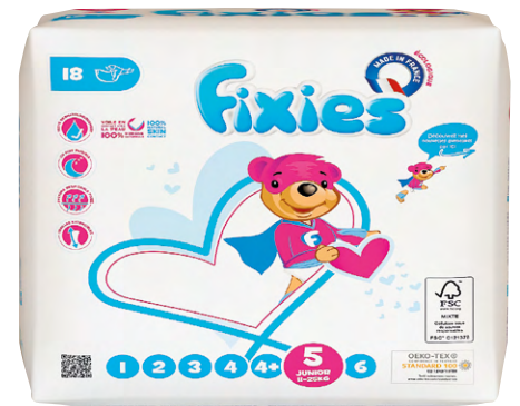
COUCHES FIXIES Le paquet de 18 à 30 couches Différentes tailles 895 F LE PAQUET