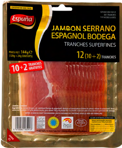
JAMBON SERRANO ESPUÑA Le paquet de 144 g 10+2 tranches Le kg : 4132 F 595 F LE PAQUET