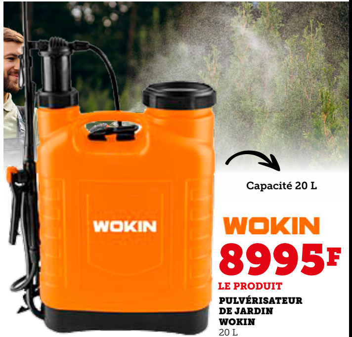
Capacité 20 L

LE PRODUIT PULVÉRISATEUR DE JARDIN WOKIN 2 L