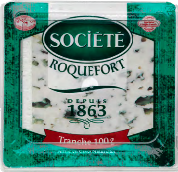
ROQUEFORT SOCI T  31% Le paquet de 100 g Le kg : 3950 F 395 F LE PAQUET