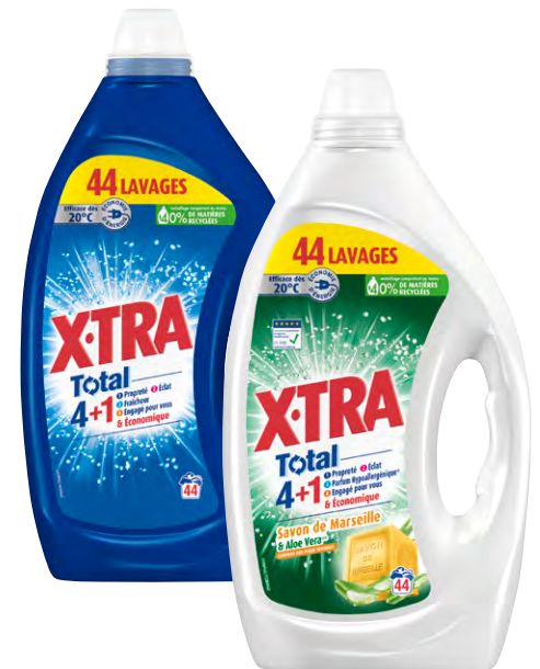
LESSIVE LIQUIDE XTRA TOTAL Savon de Marseille ou Fraîcheur Alpine Le bidon de 1,98 L Le L : 632 F 1250 F LE BIDON