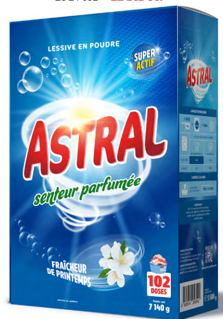
LESSIVE EN POUDRE ASTRAL La boîte de 7,14 kg 102 doses Le kg : 392 F 2795 F LE BOÎTE