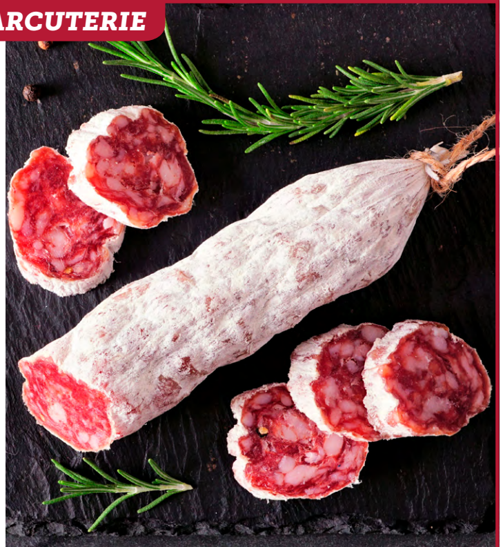
SAUCISSON D'ARLES Origine France